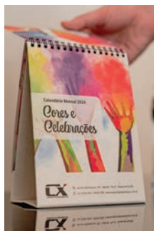
Cristian Frantz/Divulgação Gráfica Traço

A Traço trabalha com impressos gráficos em offset e digital de alta qualidade, associada a soluções de design, comunicação e branding. "Acredito que as ferramentas de IA se apropriarão muito rápido da nossa rotina", conclui Coutinho.