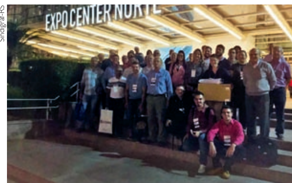
Comitiva de empresários gaúchos, organizada pelo Sindigraf-RS

por dentro das novidades do setor.” Ela relata que essa integração auxiliou muito no momento de mudanças pelo qual passa a empresa. “Trouxe bastante informações, pois estamos pensando em algumas novidades. Pretendemos investir em sublimação ainda neste ano”, anuncia. O forte da gráfica, conforme a profissional, tem sido impressão offset com uma cor. “Aproveitei para conversar com colegas, esclareci dúvidas e descobri curiosidades, inclusive sobre impressão digital”, completa. A ida na feira também a motivou em oferecer algo mais. “Enxerguei muitas possibilidades, que antes não via. Há muitas formas de inovar, resolvendo os problemas dos clientes.”