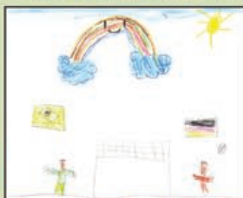
Arthur Ehlers Feser - 7 anos