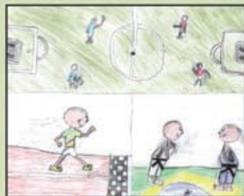
Rafael Bortolini Fortunati - 8 anos