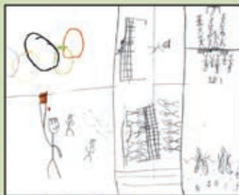
Gabriel Pitano Elzerik - 7 anos