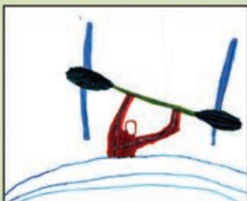
Pedro Sohne Engel - 9 anos