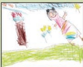
Rhiana Borges - 4 anos