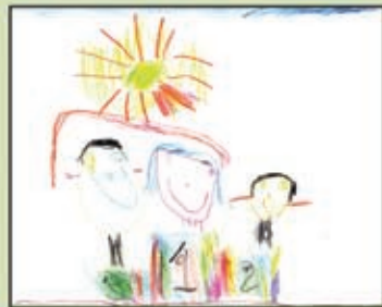
Alice Ehlers Feser - 4 anos