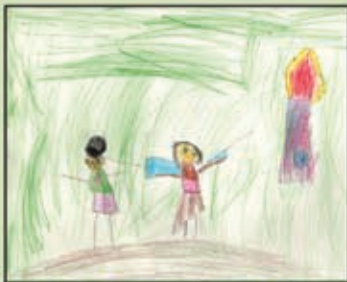
Bárbara Bortolini Fortunati - 5 anos