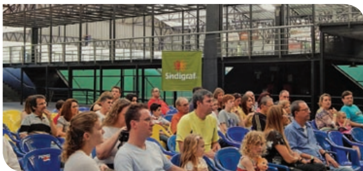
Região do Vale do Sinos/Hortênsias – Novo Hamburgo