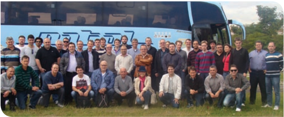
Membros da caravana aérea viajaram para evento em São Paulo