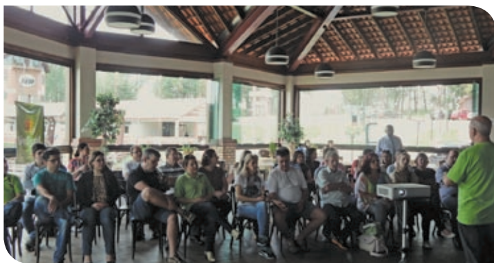
Região Produção/Planalto – Passo Fundo