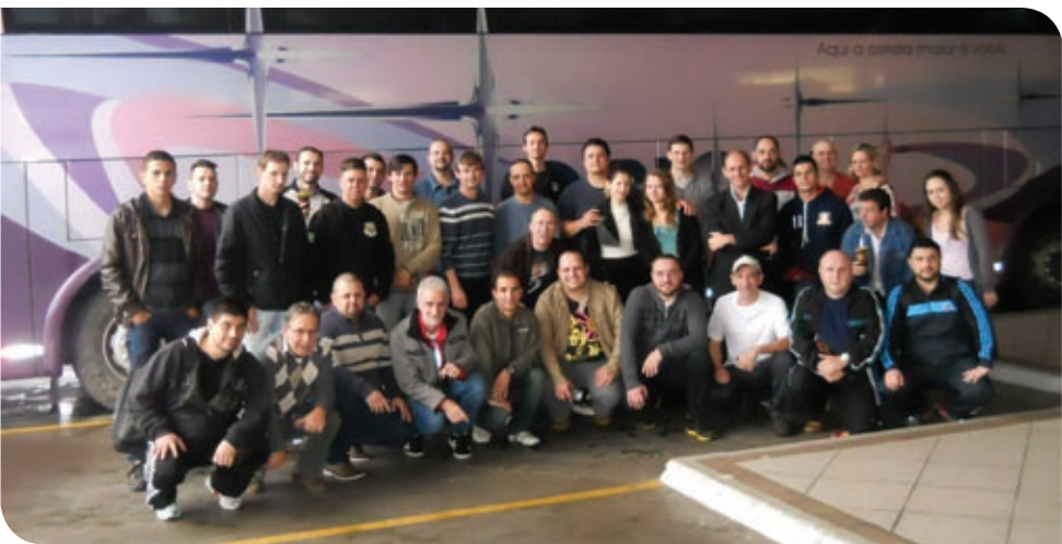
Caravana rodoviária levou 38 gaúchos para a Expoprint 2014