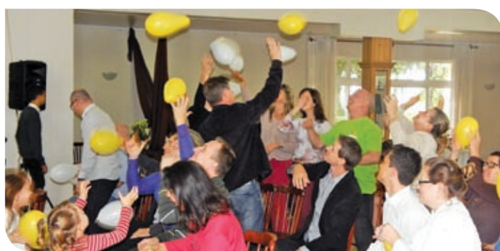
Região do Vale do Taquari/Vale do Rio Pardo – Santa Cruz do Sul