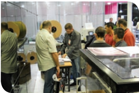
Empresários testaram maquinários expostos na feira, na capital paulista

Na caravana rodoviária, 38 pessoas – 30 empresários e oito técnicos do CEP Senai de Artes Gráficas Henrique d’Ávila Bertaso – partiram de Porto