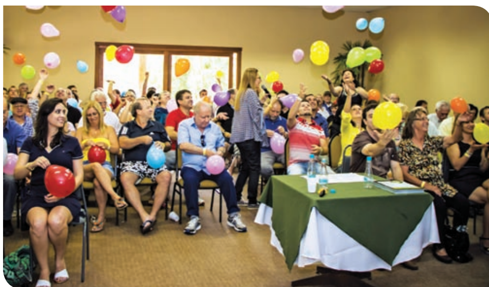
Momentos lúdicos também fizeram parte do talk show Integração + Felicidade = Ação – A fórmula do Sucesso! , como a dinâmica dos balões realizada em Viamão