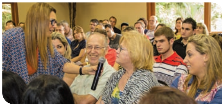
Região Metropolitana e Sul – Viamão