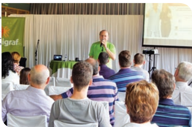
Região Noroeste/Missões – Santa Rosa