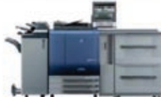
C6000 / C7000