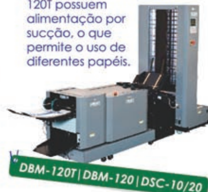
DBM-120T | DBM-120 | DSC-10/20

Compaginador DSC-10/20, Dobreadeira | Grampeadora DBM-120 e Refiladora DBM-120T possuem alimentação por sucção, o que permite o uso de diferentes papéis.