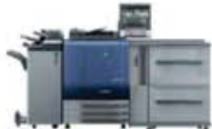
C6000 / C7000