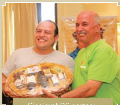
Sindigraf-RS sorteu cestas natalinas