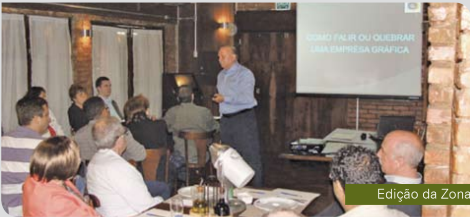
Edição da Zona Sul