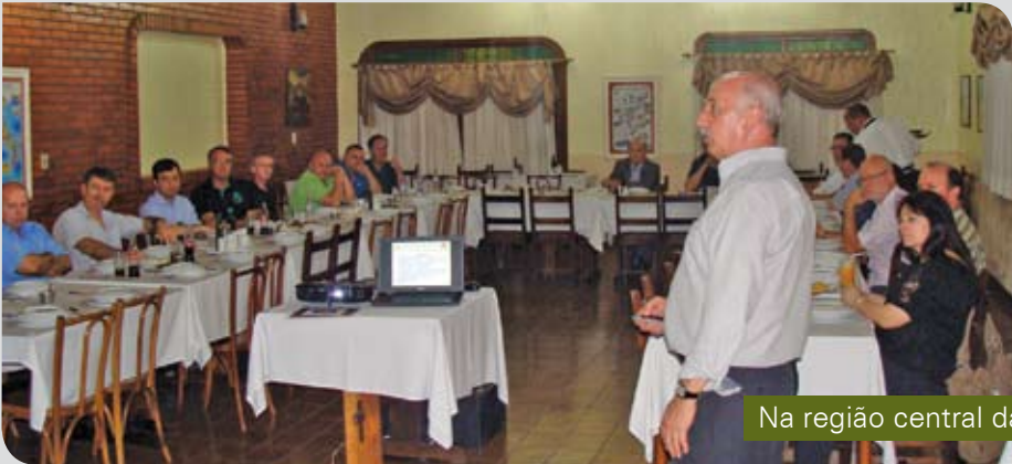
Na região central da capital