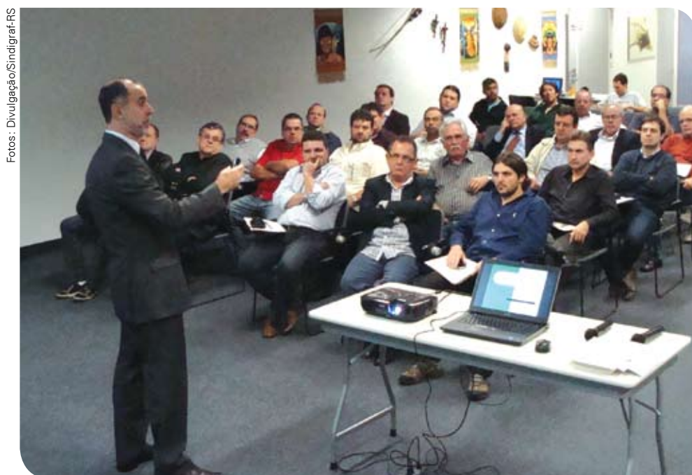
Encontro empresarial abordou o futuro da Indústria Gráfica

Para o próximo ano, as metas são continuar o processo de descentralização, aproximando o Sindigraf-RS das gráficas em todo o Estado, assim como defender ainda mais os interesses do setor. Associadas e afiliadas, contem com a entidade.