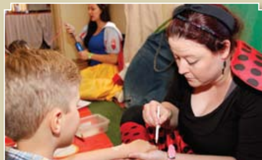
Pequenos tiveram espaço próprio no Salão Emplúvio