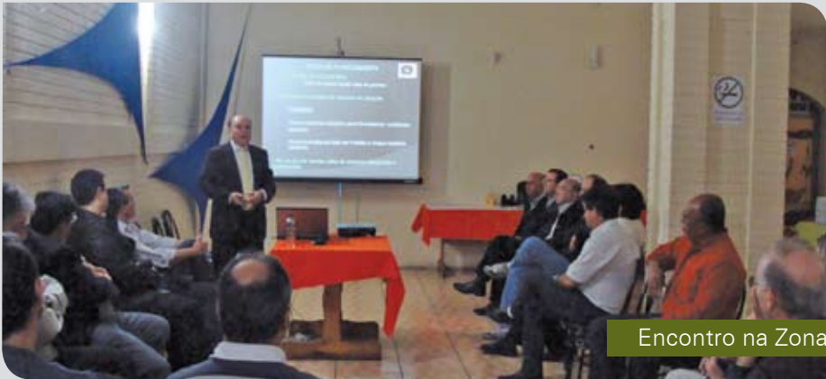
Encontro na Zona Leste