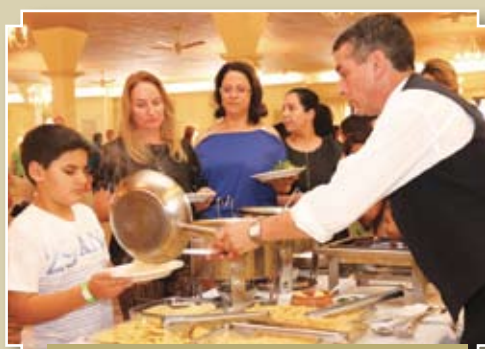
Convidados contaram com um delicioso almoço