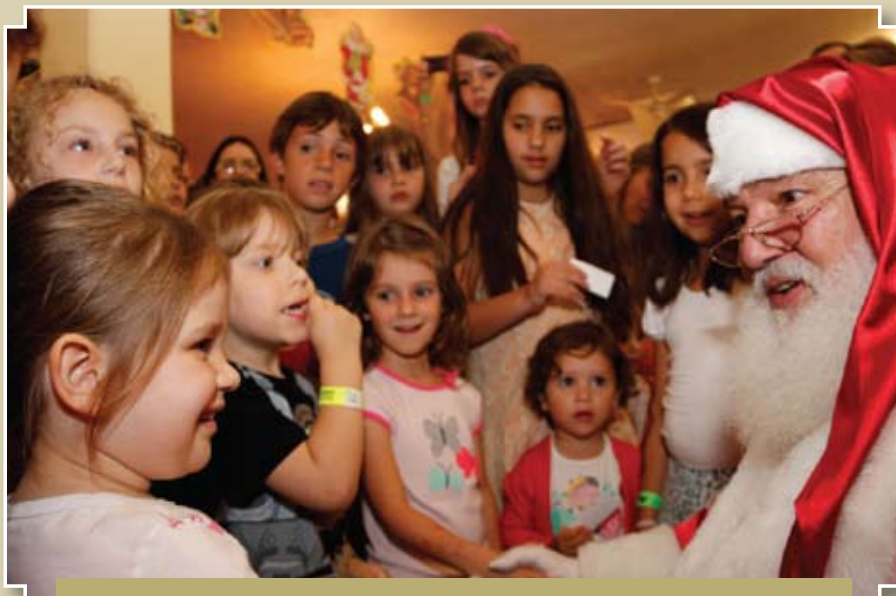
Criançada fez seus pedidos ao Papai Noel