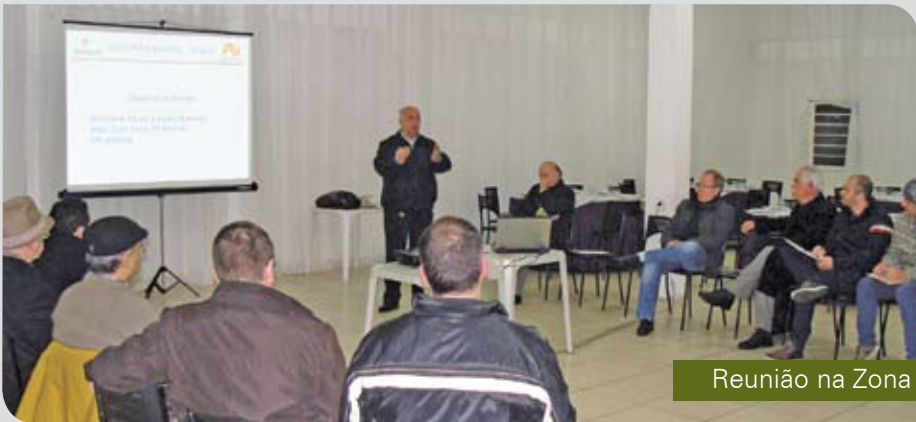
Reunião na Zona Norte