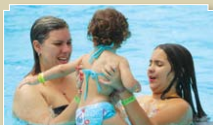
Famílias aproveitaram espaços de lazer do Laje de Pedra