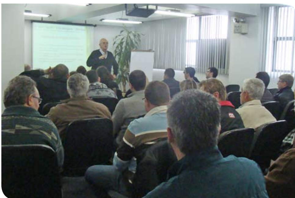
Curso sobre vendas reuniu mais de 90 pessoas em duas edições