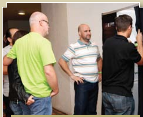
Cabine fotográfica disponibilizou lembranças da festa