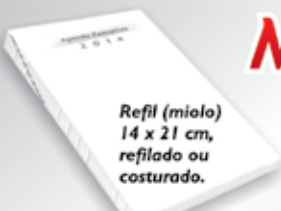
Refil (miolo) 14 x 21 cm, refilado ou costurado.

Brinde seus clientes com agendas Salles. Solicite catálogo.