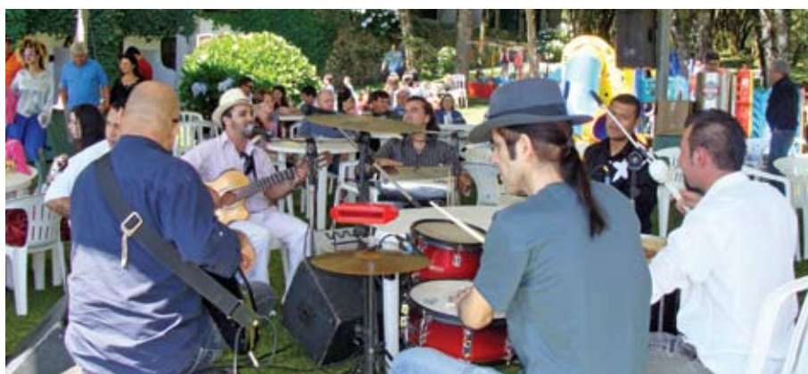
Em 2009, música e animação

Pausa nos compromissos de trabalho, hora para o lazer. No dia 4 de dezembro, acontece a Festa de Fim de Ano, no Hotel Laje de Pedra, em Canela. A Abigraf-RS já está organizando uma programação repleta de atividades para animar a grande família gráfica gaúcha. Da manhã à tarde, brincadeiras, diversões, novidades e a tão esperada chegada do Papai Noel. Para os interessados em estender a viagem e aproveitar o final de semana na região serrana, a entidade fez uma parceria com o Laje de Pedra a fim de viabilizar hospedagem com tarifas especiais. Exclusivo para os inscritos na festa, o pacote promocional compreende duas diárias, de sexta-feira a domingo, com café da manhã. Assim, além de participar deste tradicional encontro de congraçamento do setor, o empresário gráfico e seus familiares poderão prestigiar as atrações natalinas típicas de Gramado e Canela.