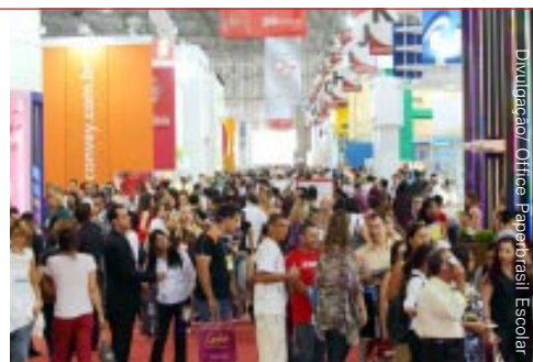
Movimento na edição de 2009

Horário: 30 de agosto a 1º de setembro, das 13h às 21h, e 2 de setembro, das 11h às 18h