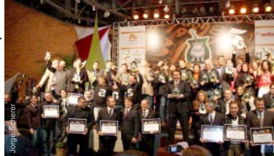
Um time de 24 empresas premiadas em 2009