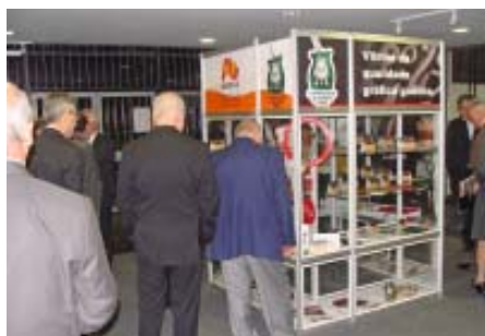
Exposição das peças premiadas

sos? Mesmo diante de uma era digital não vamos abrir mão dos livros, jornais, folhetos e embalagens e tudo que as gráficas nos disponibilizam”. Após o evento, os presentes puderam prestigiar a exposição das peças vencedoras do 5º Prêmio Gaúcho de Excelência Gráfica, expostos no saguão da Câmara Municipal. A visitação permaneceu aberta na Câmara até 3 de setembro. Com a iniciativa, a Abigraf-RS objetivou mostrar aos diversos públicos o que o Estado imprime de melhor!