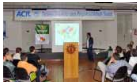
Encontro Pós-Drupa viajou pelo interior do Estado

Abigraf-RS ainda promoveu os Encontros Pós-Drupa. A iniciativa alcançou empresários gráficos de Porto Alegre e das regiões Vale do Taquari/Rio Pardo (Lajeado), Centro-Oeste (Santa Maria) e Sul/Sudeste (Pelotas).