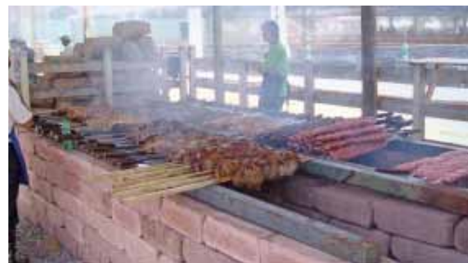
Churrasco foi o cardápio do dia