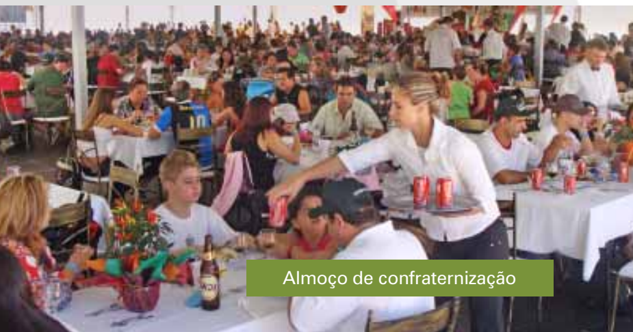
Almoço de confraternização