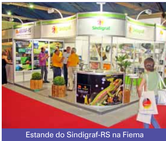
Estande do Sindigraf-RS na Fiema

O Sindigraf-RS participou da Feira Internacional de Tecnologia para o Meio Ambiente – Fiema Brasil, que