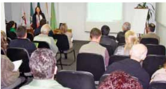
Palestras e cursos levaram conhecimento ao setor

naturais com produção industrial. No decorrer de 2008, ocorreram as palestras Como obter o Licenciamento Ambiental , Gerenciamento de Resíduos Sólidos e Tratamento de Efluentes Líquidos . Palestras jurídicas também tiveram destaque na programação do Sindigraf-RS, levantando questões de legislação como Base de Cálculo do Adicional de Insalubridade, regime de compensação e banco de horas, indenização por acidente do trabalho e