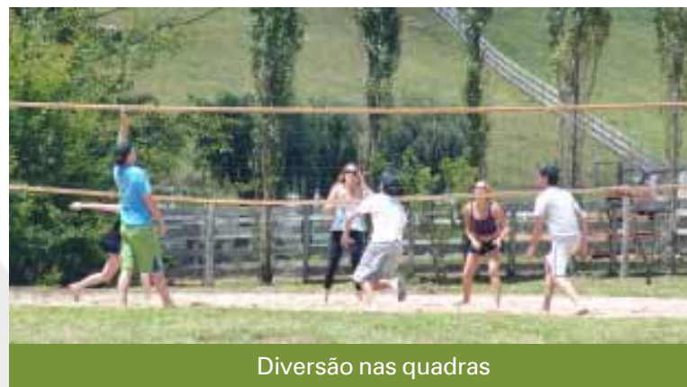
Diversão nas quadras