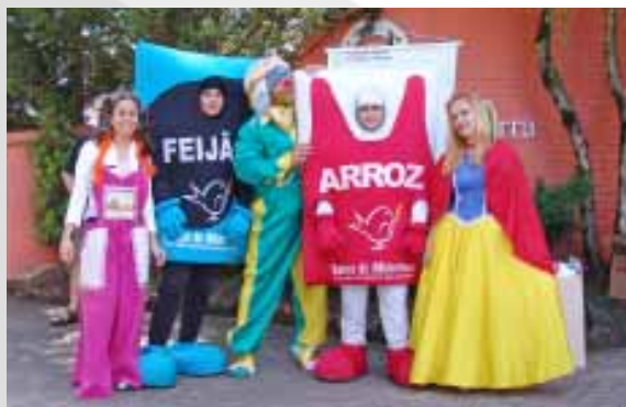
Convidados foram recepcionados