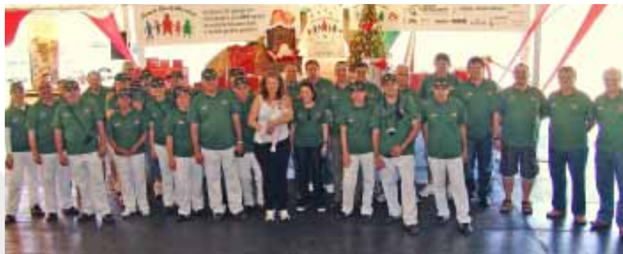
Homenagem aos colaboradores e diretores das entidades