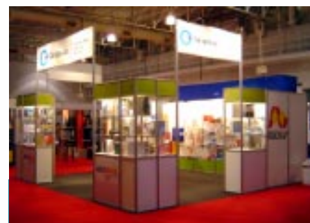
Estande do Graphia em feira Expo Ofimática, ocorrida na Argentina em Agosto/06

tar a realização de diversas missões comerciais e a participação em variadas feiras internacionais em outros continentes. Embora envolva, em sua maioria, empresas paulistas, o Graphia pretende expandir sua atuação para outros estados. Empresas interessadas em integrar o grupo podem buscar informações com a Abigraf Nacional, pelo telefone (11) 5087-7790 ou pelo e-mail: wsilva@graphia-alliance.org.br .