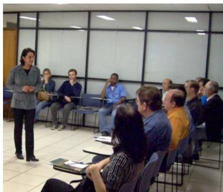
Palestra procura motivar as empresas a cuidar dos resíduos

D esenvolver uma consciência ecológica no setor gráfico, preservando a natureza e reduzindo custos. Essa é a filosofia do Grupo de Trabalho (GT) Ambiental do Sindigraf-RS, criado há sete anos pela entidade. Formado por empresários e colaboradores de empresas filiadas, o grupo vem desenvolvendo diversas ações, com o objetivo de multiplicar a consciência ambiental entre os empresários gráficos.