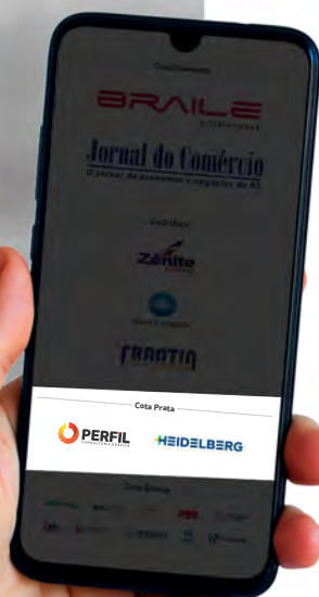
Layout das separações de cotas das empresas patrocinadoras de 2023