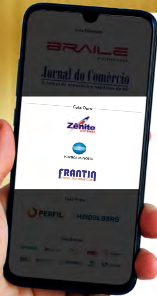
Layout das separações de cotas das empresas patrocinadoras de 2023